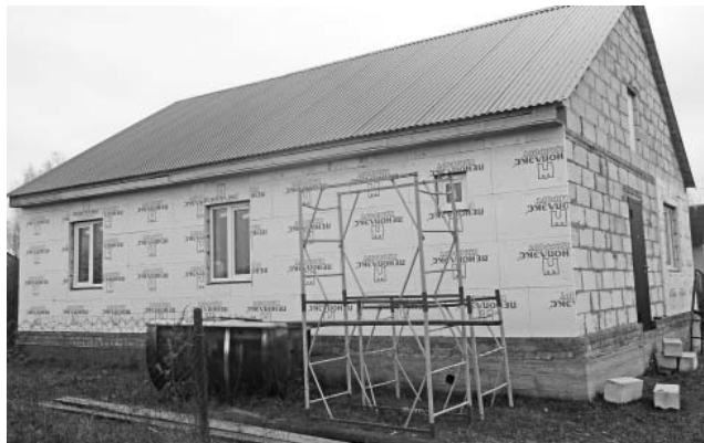
Строительство дома по профильной программе в деревне Пырненка.

Подробную информацию о предоставлении субсидий на жилье можно получить в отделе сельского хозяйства и продовольствия МР «Думиничский район» по адресу п.Думиничи, ул.Ленина д.21 или по телефону 9-14-94.