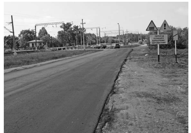
На радость автолюбителям и пассажирам. Отремонтированы наиболее проблемные участки дорог на въезде в п.Думиничи и по пути в пристанционный поселок.